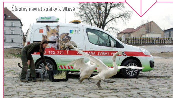
Šťastný návrat zpátky k Vitavě