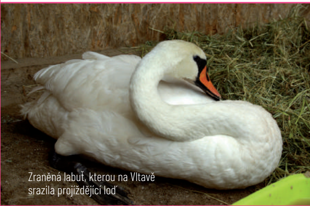
Zraněná labuť, kterou na Vltavě srazila projíždějící loď