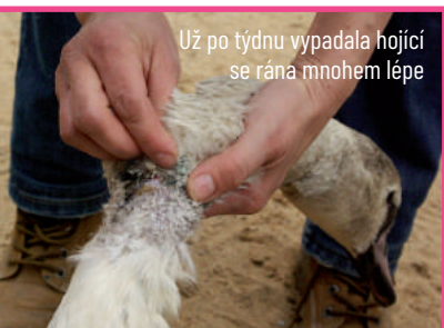
Už po týdnu vypadala hojící se rána mnohem lépe

Veterinární lékařka ránu hned vyčistila a zašila. Pořád však hrozilo velké riziko, že labuť podlehne nějakému vnitřnímu zranění po pádu z velké výšky nebo že se projeví infekce. Důsledná veterinární péče a pravidelné podávání antibiotik však nebezpečí postupně zažehnaly a statečnou labuť, jejíž vůli k životu nehoda nedokázala zpřetrhat, se ve stanici podařilo zachránit. Po třech týdnech léčby a rekonvalescence se mohla vrátit zpět mezi labutě na Vitavu. Jen s jednou životní jízvou navíc.